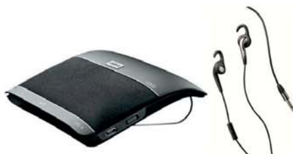
Jabra Freeway + Jabra Chill

* Totalpris 4487,- inkludert telefon m/ FlexiTalk 199 i 12 mnd.