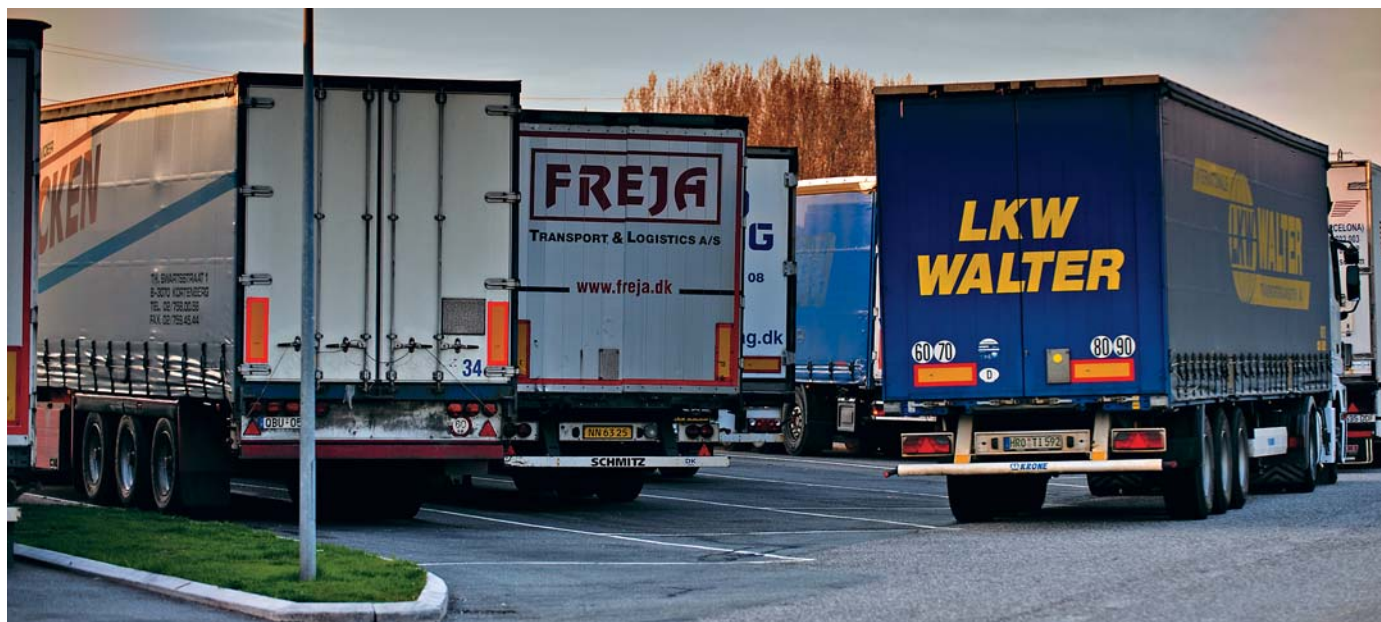
Det er lite samarbeid om sikkerhet mellom transportørene i godsbransjen, og det trengs både kunnskap og forståelse for at investeringer i sikkerhet koster penger. Tiltakene koster, men det lønner seg så aboslutt i lengden.