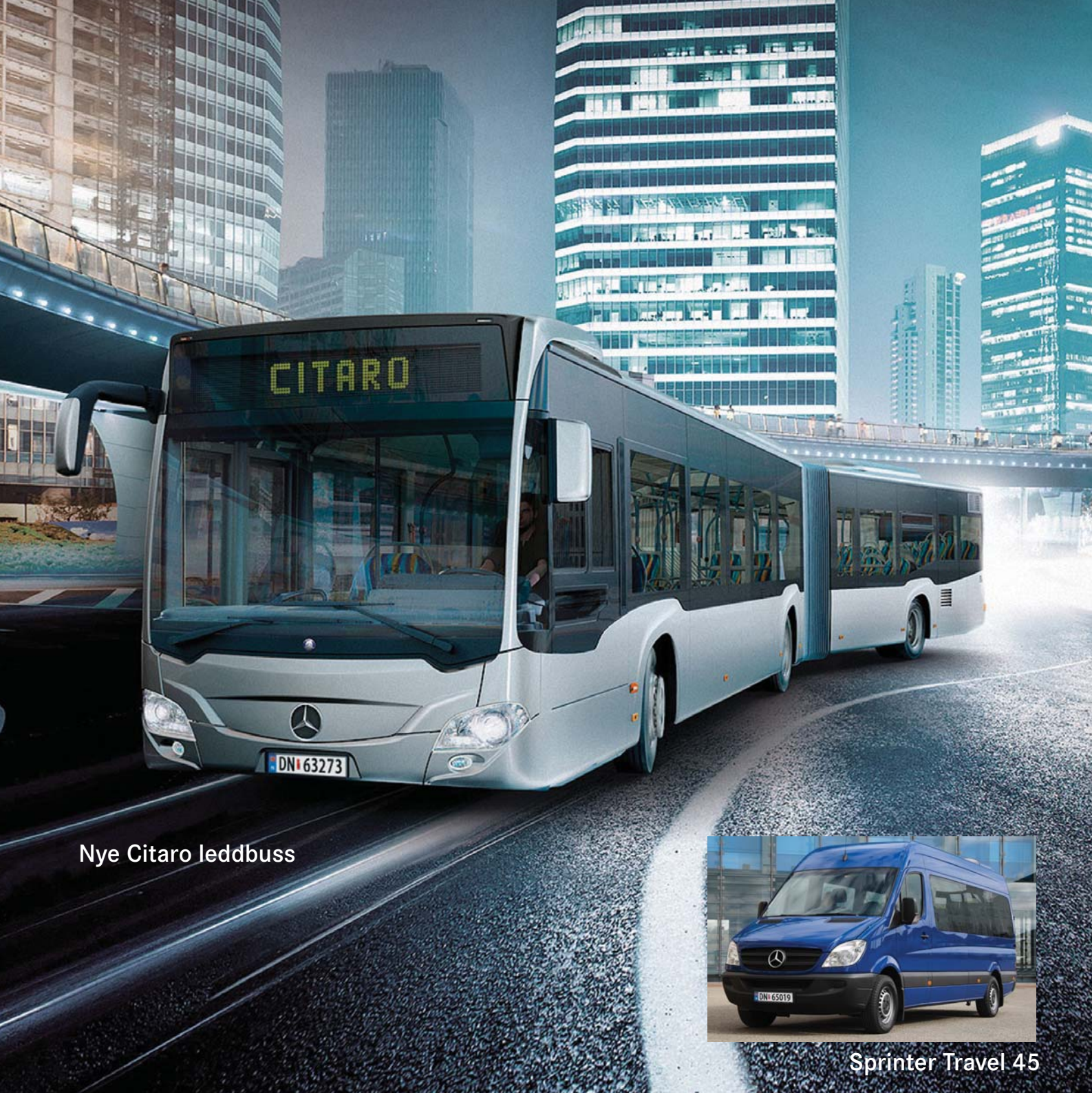
Nye Citaro leddbuss