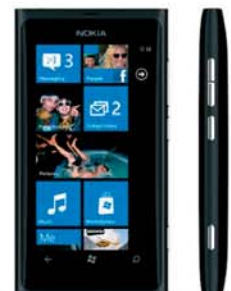
Nokia Lumia 800 Black