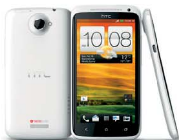
HTC One X White